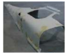
From a part to ...