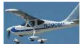
... to a final aircraft built from the digitized data.