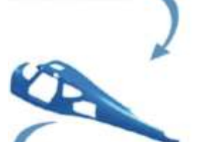
... to model...