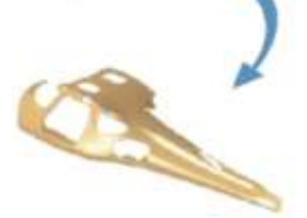
... a scan and a STL file...