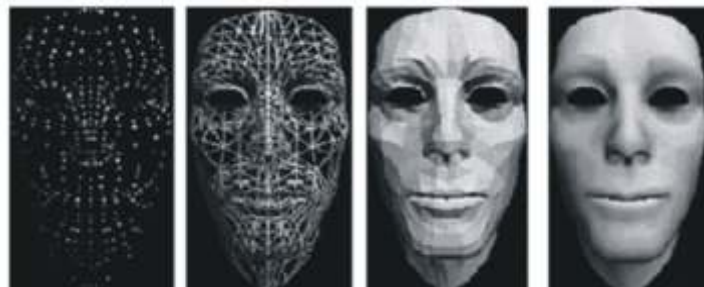
Etapas da reconstrução tridimensional

A maioria das aplicações usam modelos 3D poligonais, modelos de superfície tipo NURBS ou entidades CAD editáveis. O processo de conversão de uma nuvem de pontos num modelo 3D, é chamado de reconstrução ou modelação .